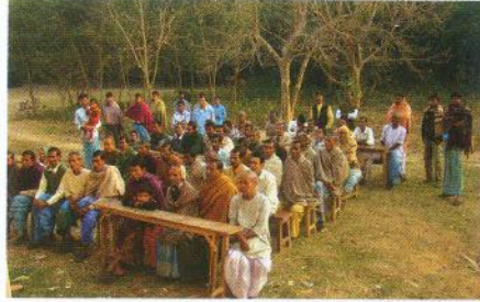
‘সেরিসিলিন’ প্রযুক্তি সচেনতা শিবির