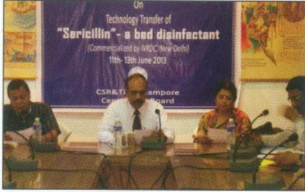
‘সেরিসিলিন’ প্রযুক্তি হস্তান্তর এর প্রশিক্ষণ